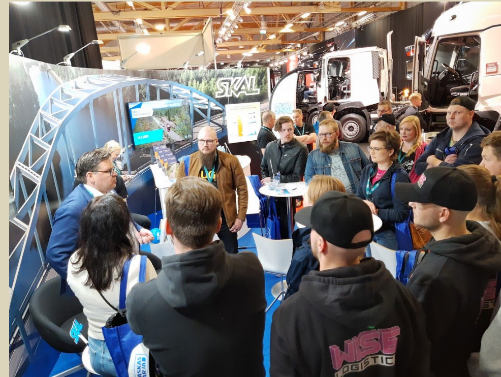
Kuva 27.5.2024 Jyväskylä, Kuljetusmessut