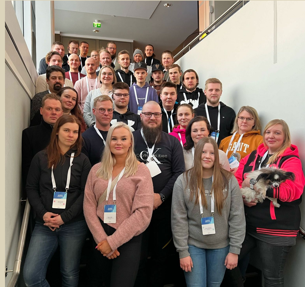
Kuva 10.02.2024 Oulu, SKALin nuorten verkoston tapaaminen