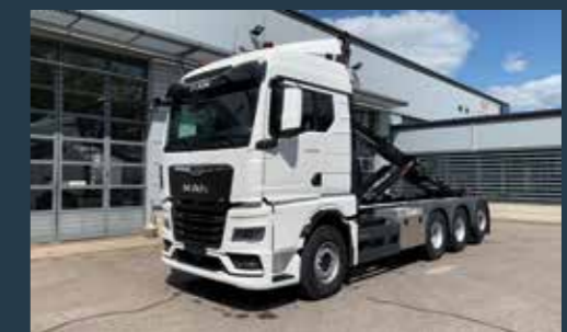
MAN TGX 35.510 BL 8x4-4 Hyvät varusteet, Hiab koukkulaite

Ole yhteydessä lähimpään MAN-myyjääsi ja pyydä tarjous: