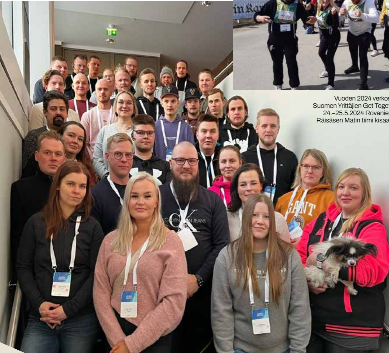
Verkoston tapaaminen Oulussa helmikuussa 2024.