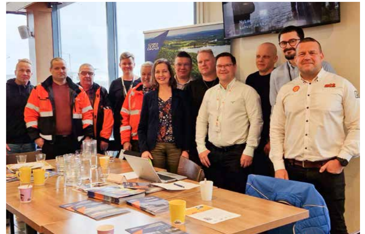
SKAL Liikenteessä -päivänä 20.3.2024 Laitilan Shellillä kohtasivat SKALin läheiset yhteistyökumppanit St1 ja Pohjola Vakuutus sekä jäseniä ja sidosryhmiä.

www.op.fi/yritykset/vakuutukset/a-vakuutus-palvelut