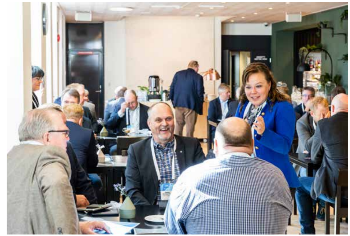
SKALin jäsenet tapaavat ja verkostoituvat tapahtumissa.

Asianajotoimisto Sivenius, Suvanto & Co Oy Mannerheimintie 15 A, 00260 Helsinki Puh. 09 530 6760 www.sisulaw.fi