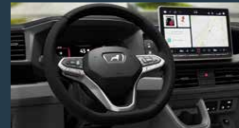
MAN TGE 3.180 4x4 Automaatti, Umpiauto, alusta sekä Doppel

Tässä muutama esimerkki vapaista autoista: