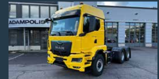
MAN TGS 33.520 BL 6x4H Veturi, Hydro etuveto