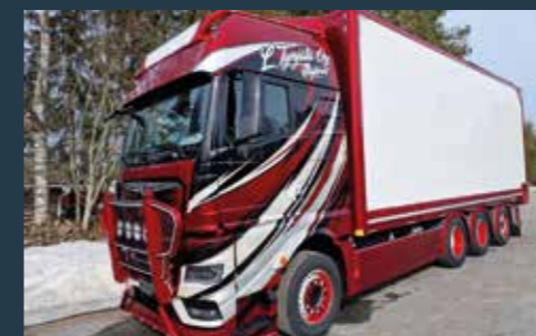
MAN TGX 35.580 BL 8x4-4 Hyvät varusteet, Matec hakekori pituus 8,7m, Kuvan auto lisävarustein ja kuvituskuva